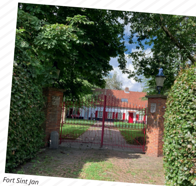
Fort Sint Jan

Vandaag deel 12, Zuiddorpe: Sterk Zeeland, strijdtoneel in de Delta. Het is een beestenboel rond Zuiddorpe. De Ratte, de Muis, Schaa(dijk) en Bontekoe zijn zomaar wat dieren die je er kan tegenkomen. Na de bezetting door de Spanjaarden maakten de inwoners korte metten met de Spaanse (katholieke) namen van straten en buurten. Fort Sint Jan werd De Ratte en Fort Sint Marcus, de Muis.